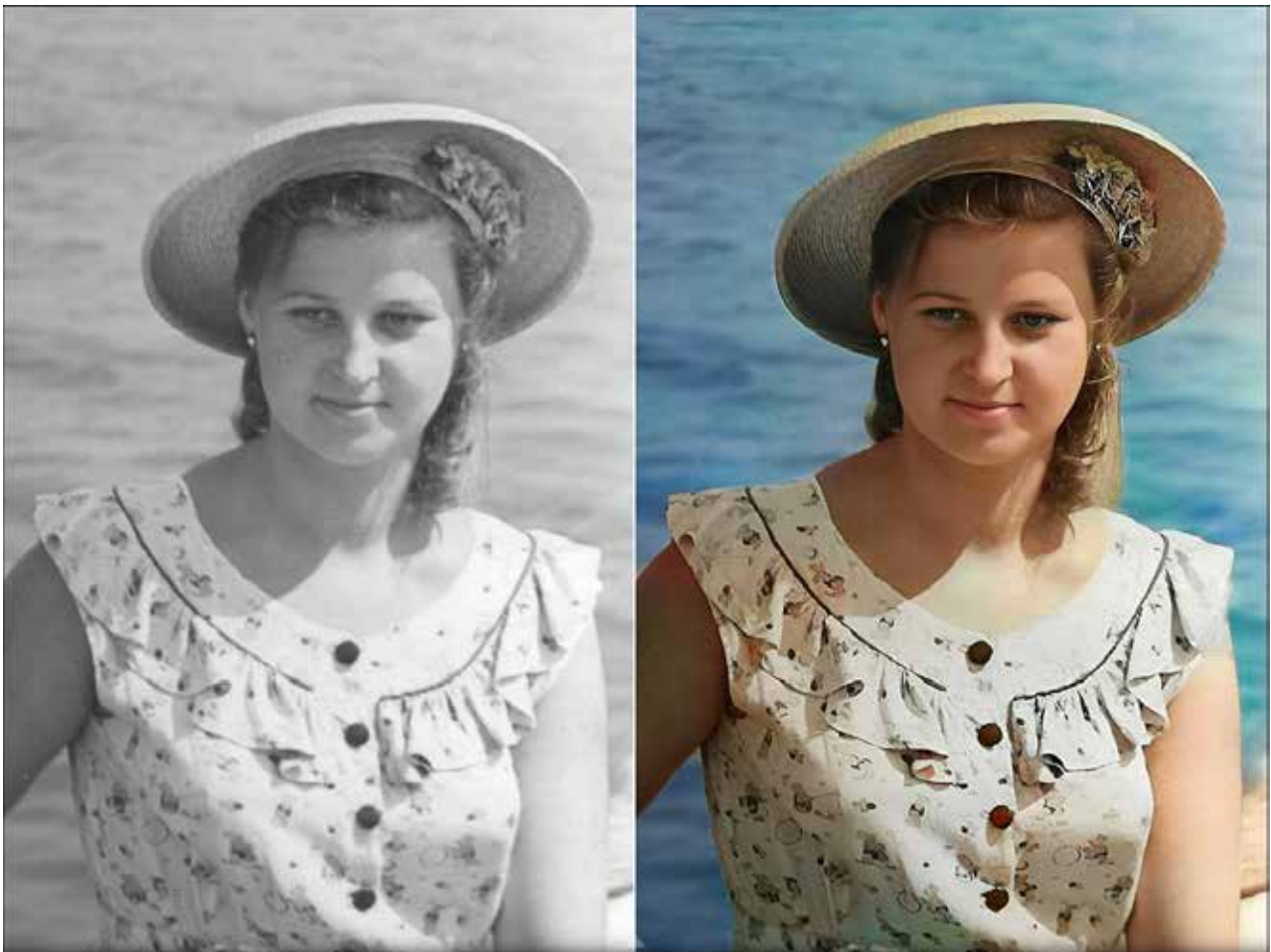
Рис. 2. Відновлення старої фотографії за допомогою сервісу Remini

Розглянемо роботу штучного інтелекту Remini на прикладі (рис. 2).