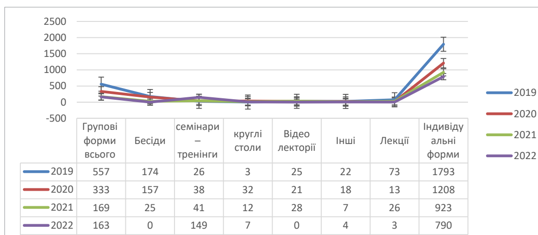
Рис. 2. Аналіз форм психологічної підтримки молоді за 2019–2022 роки, здійснених у структурі КНП «УМЛ» УМР

Показник групової взаємодії з питань ППД, просвітніх заходів за 2019–2022 роки (39403 особи) та за 2022–2023 роки (2652 особи) є результатом врахування запитів клієнтів та представників їхніх родин з питань, що